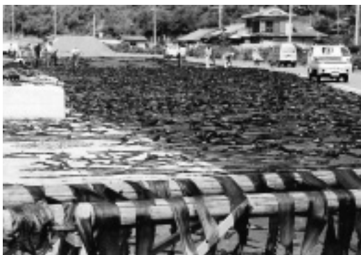
東町でのコンブの乾燥風景（1995年6月）。