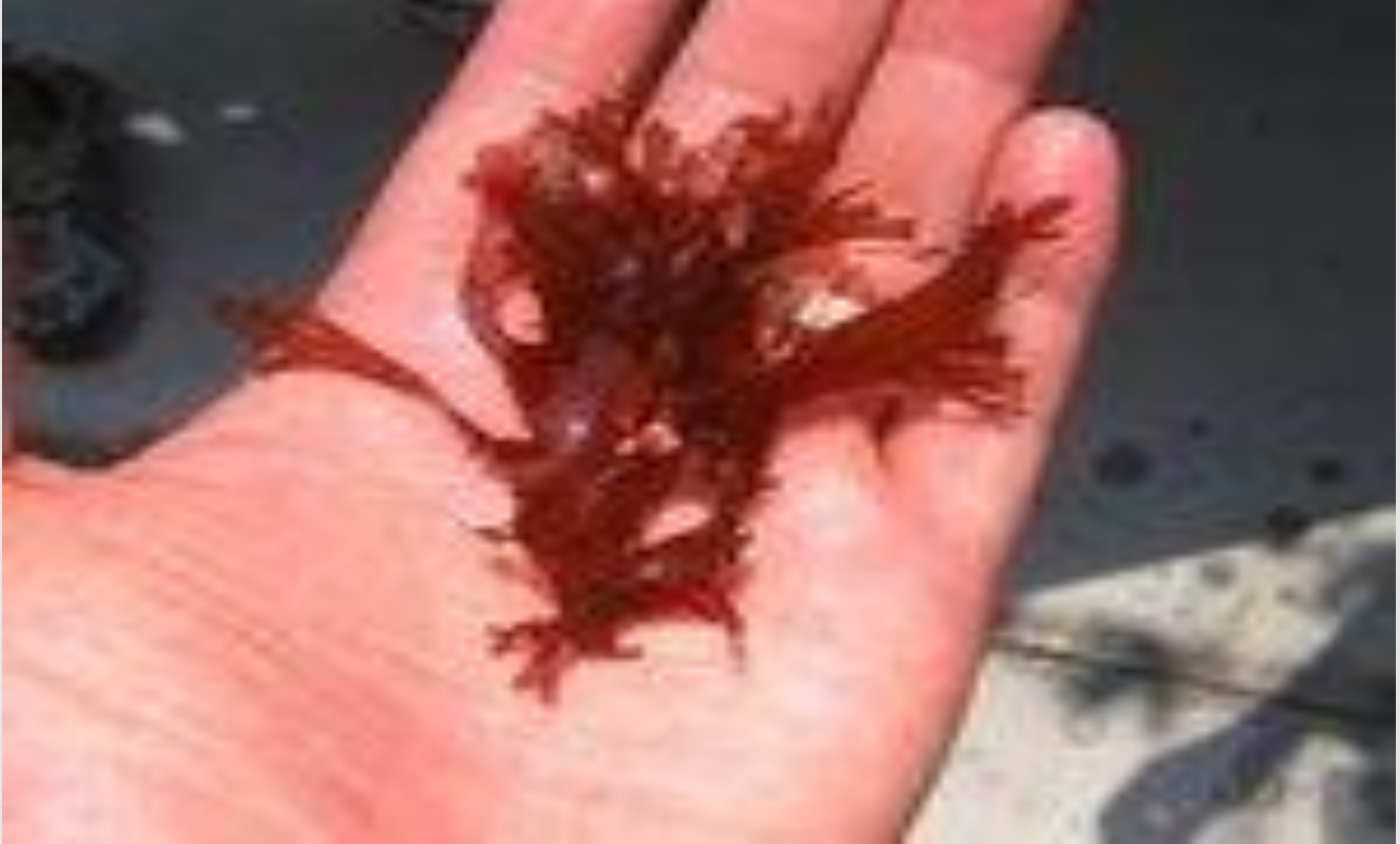
紅藻 Halymenia の無性的繁殖