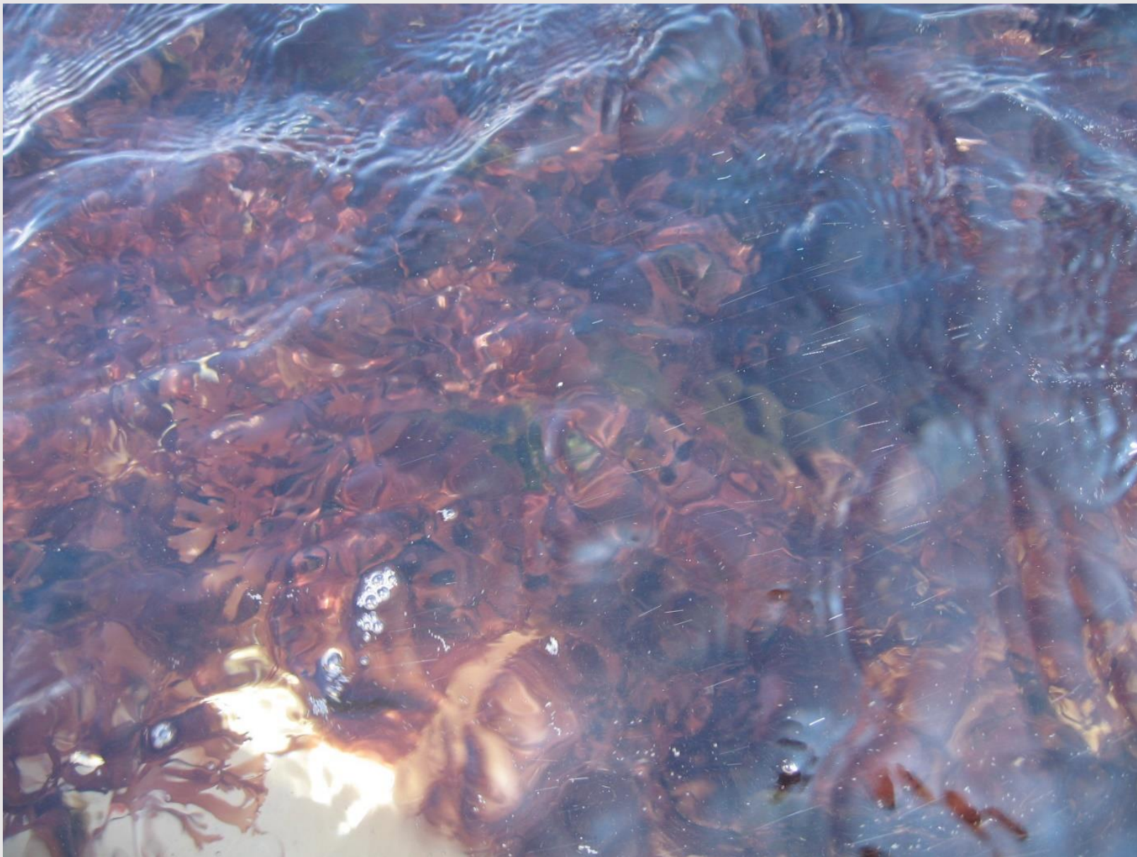
海藻を高密度培養