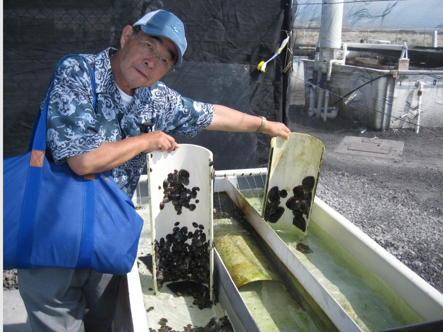
稚貝育成版(半円形)