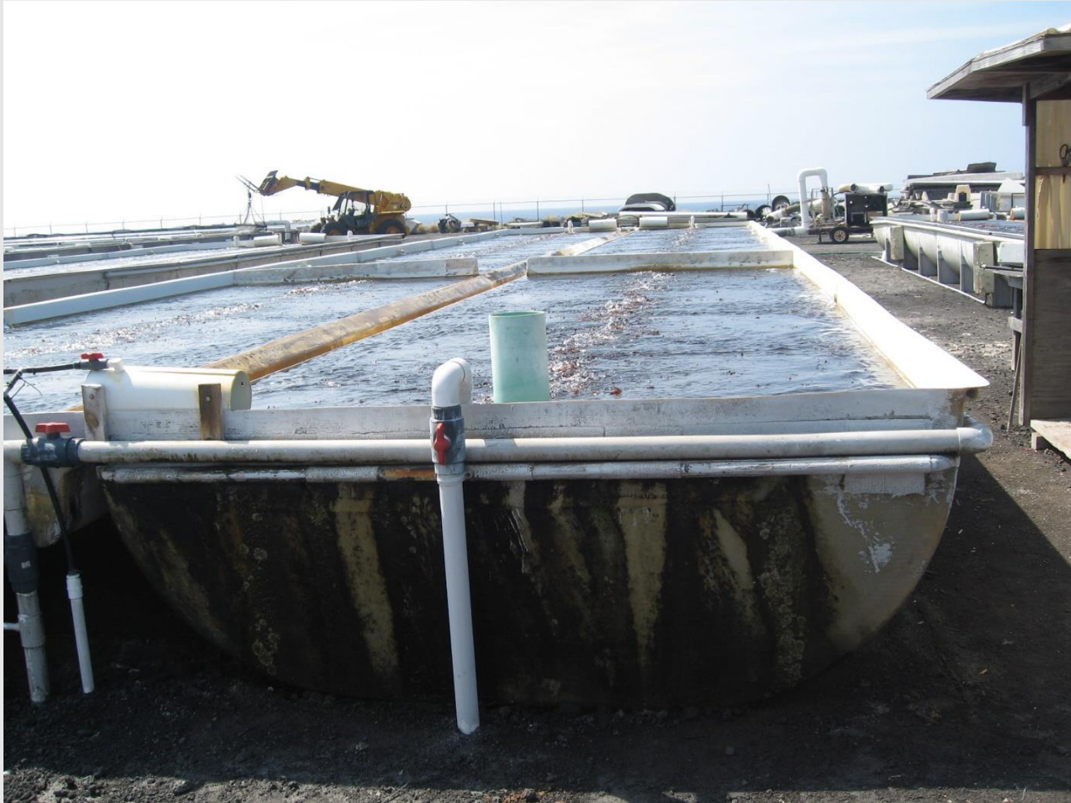
海藻養殖用タンク(半円形が特徴的である)