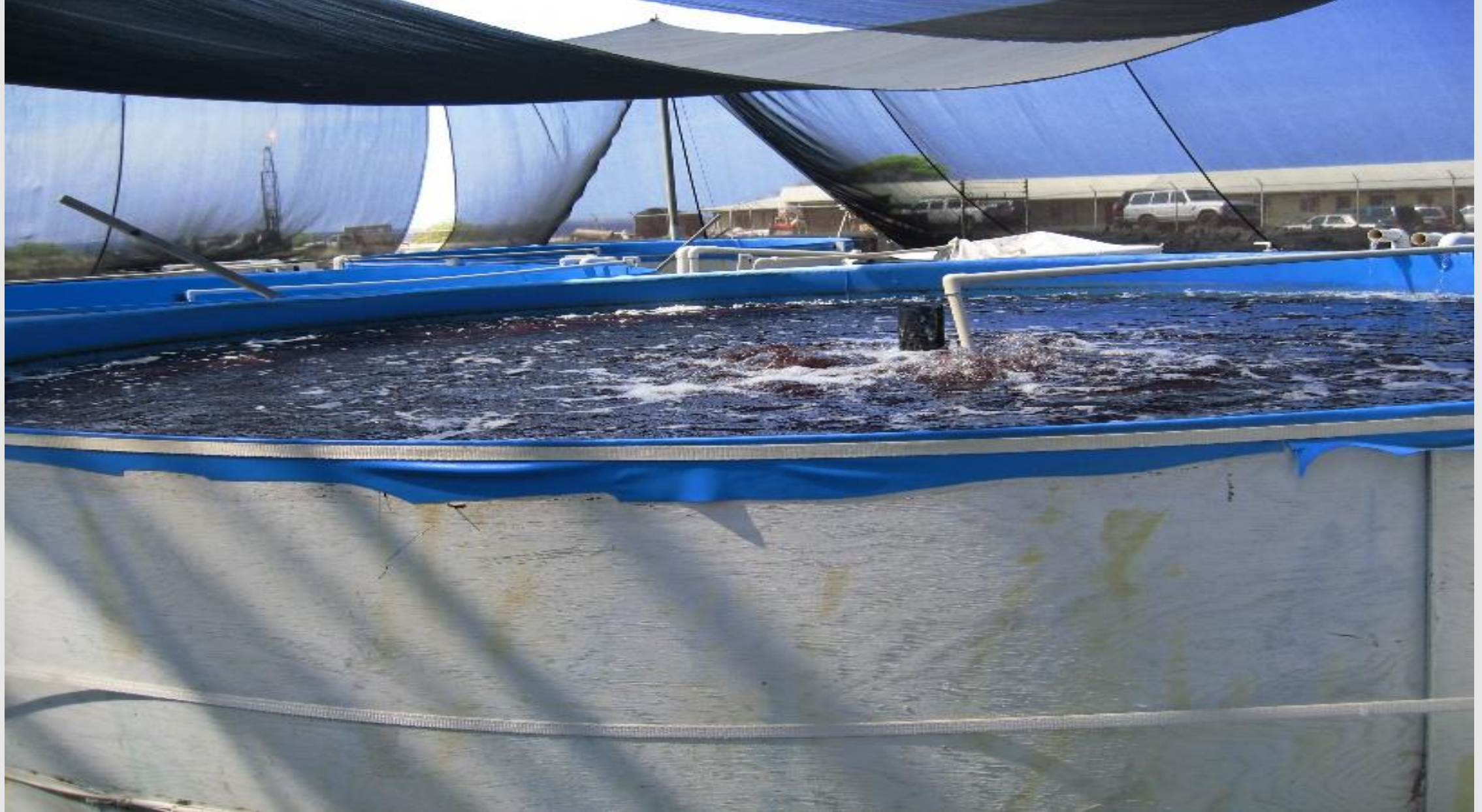
紅藻 Gracilaria · Culture Tank