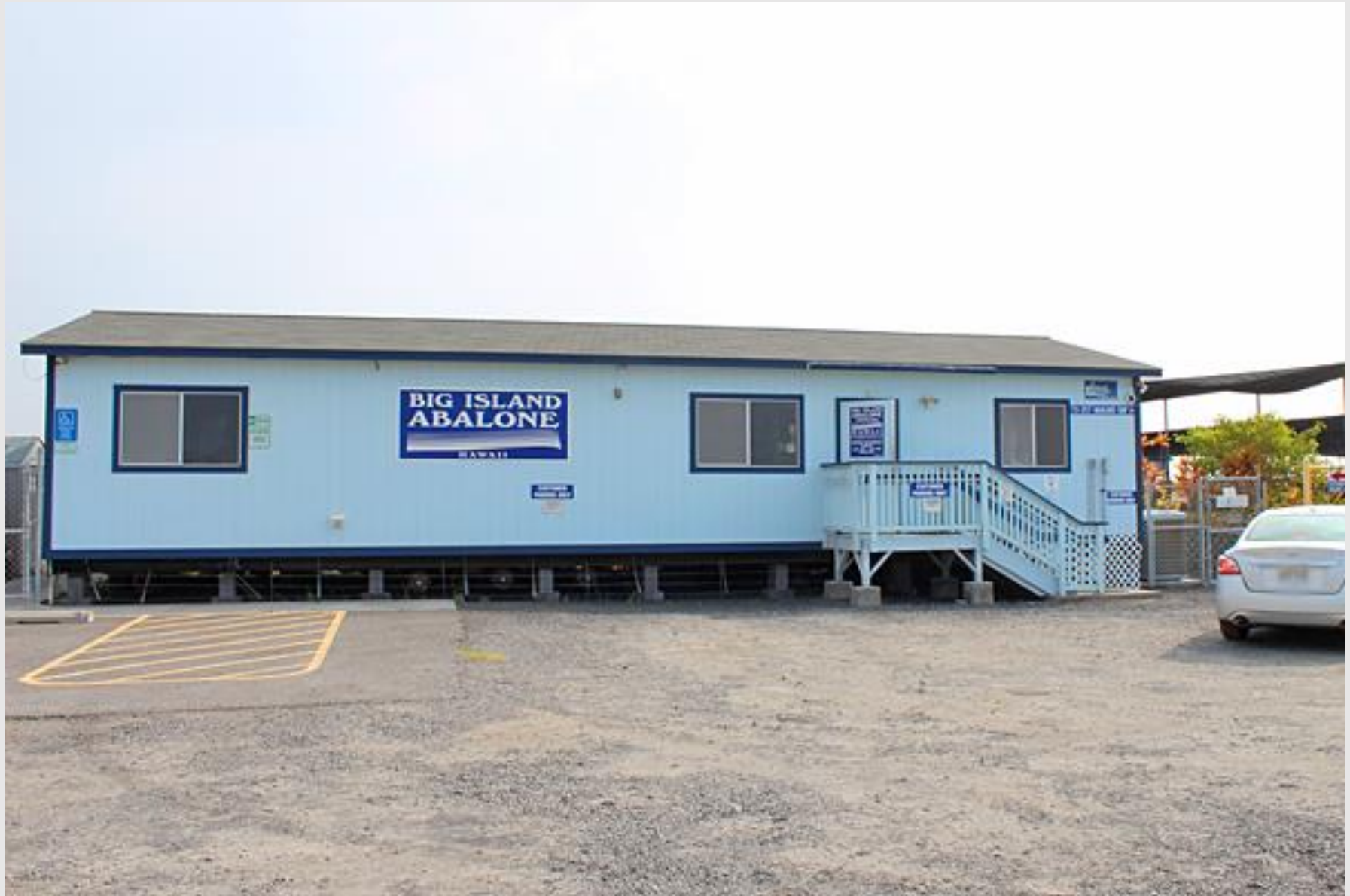
事務所兼研究室・管理室