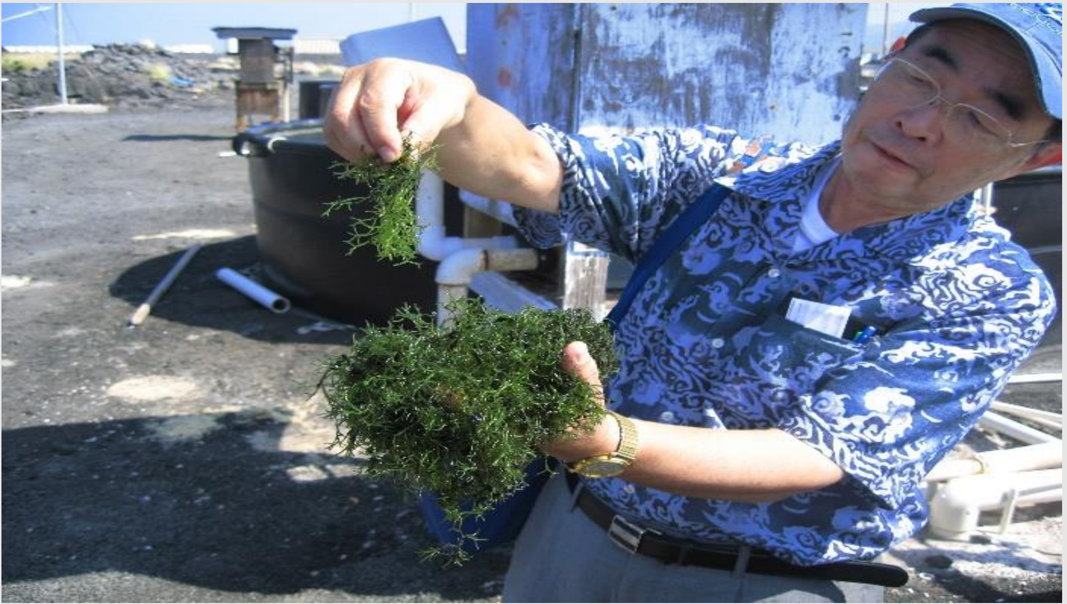
The materials of seaweed slade with Gracilara