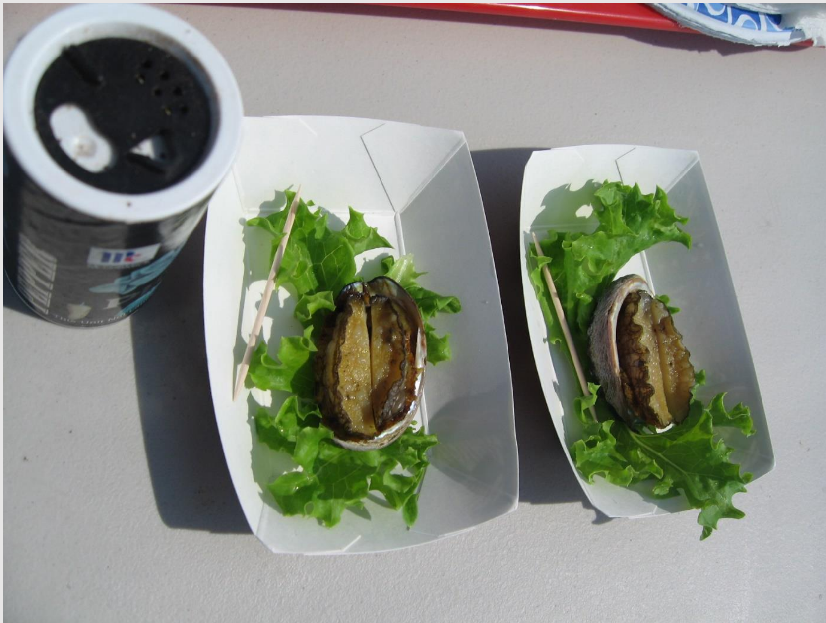
見学者用の試食用アワビ