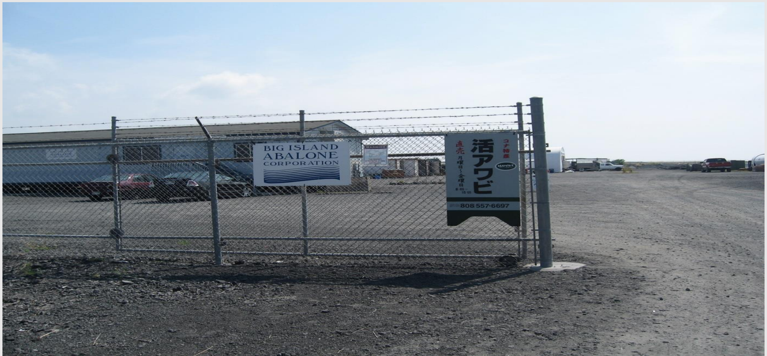
Big Island Abalone Cooperationの入口