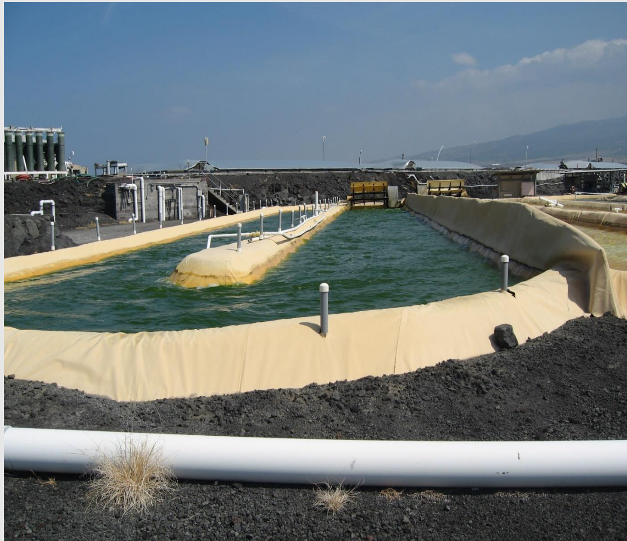
微細藻類・藍藻培養