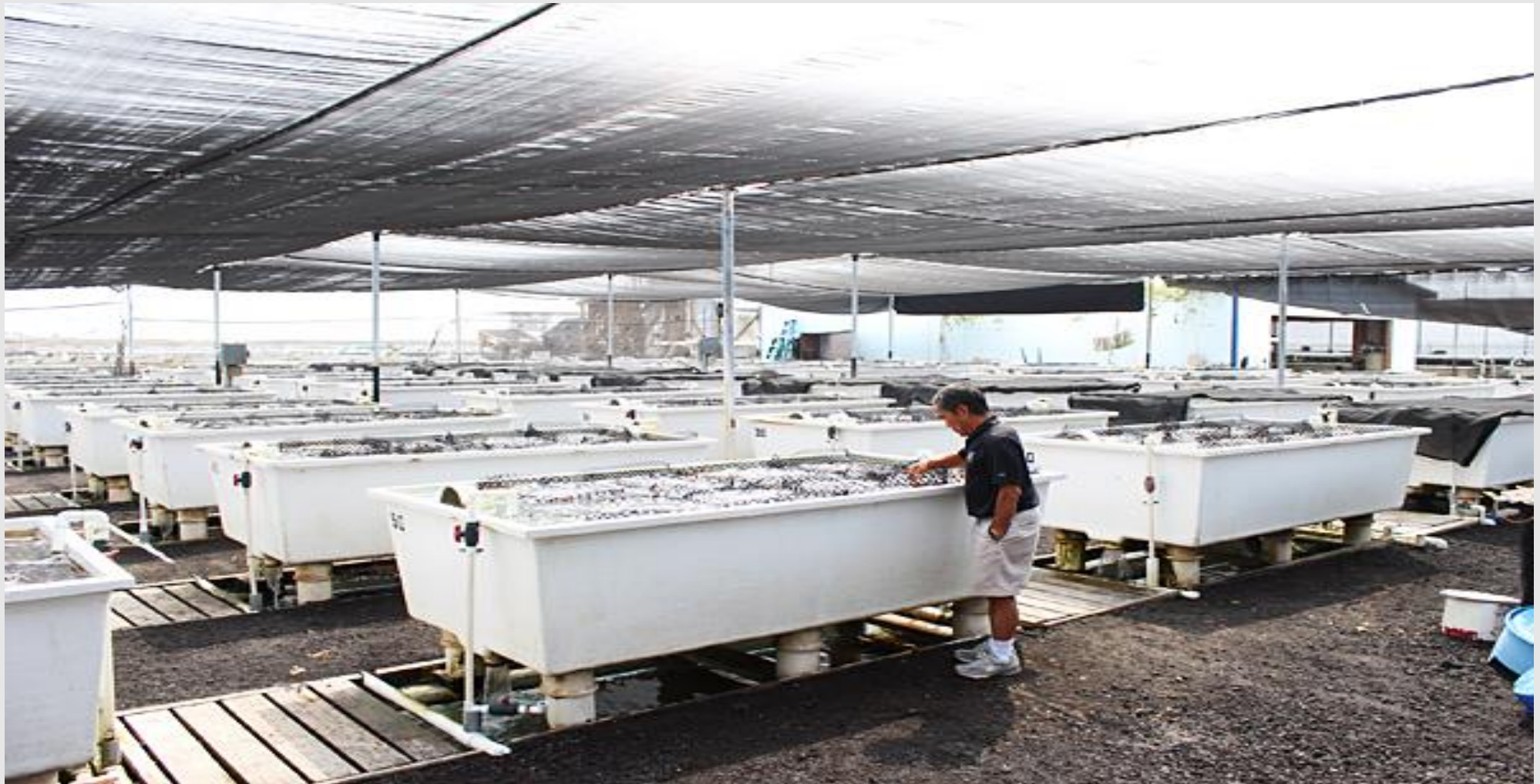
稚貝育成Tank(配合飼料)