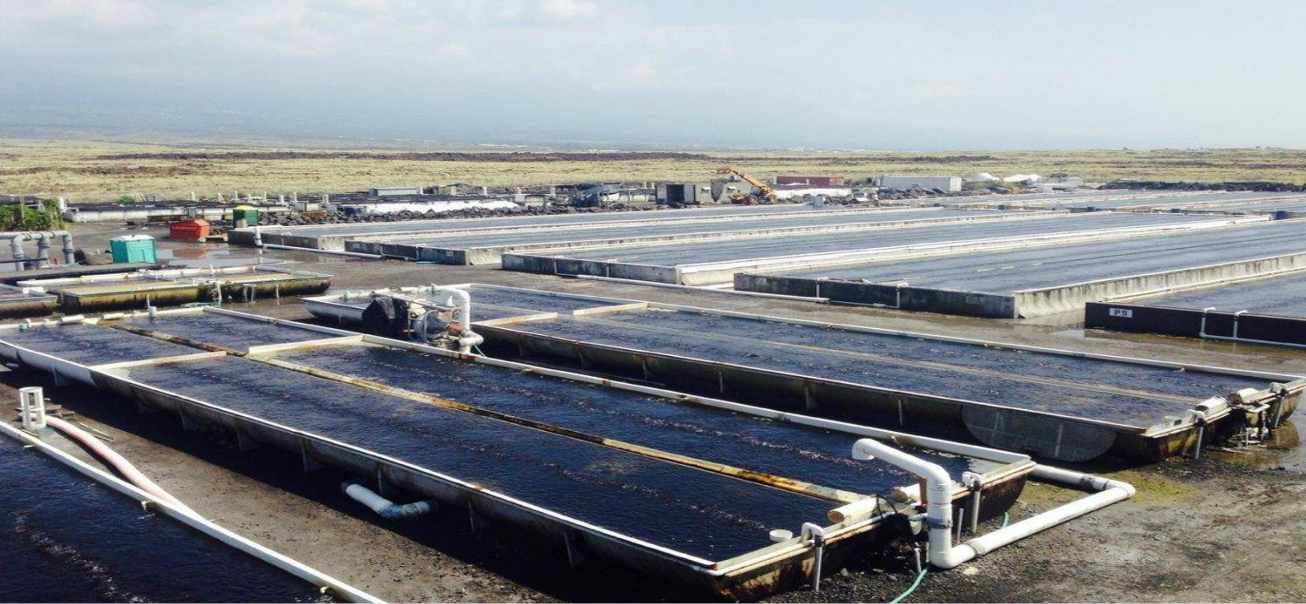
培養施設全景（右：海藻、左：Abalone）