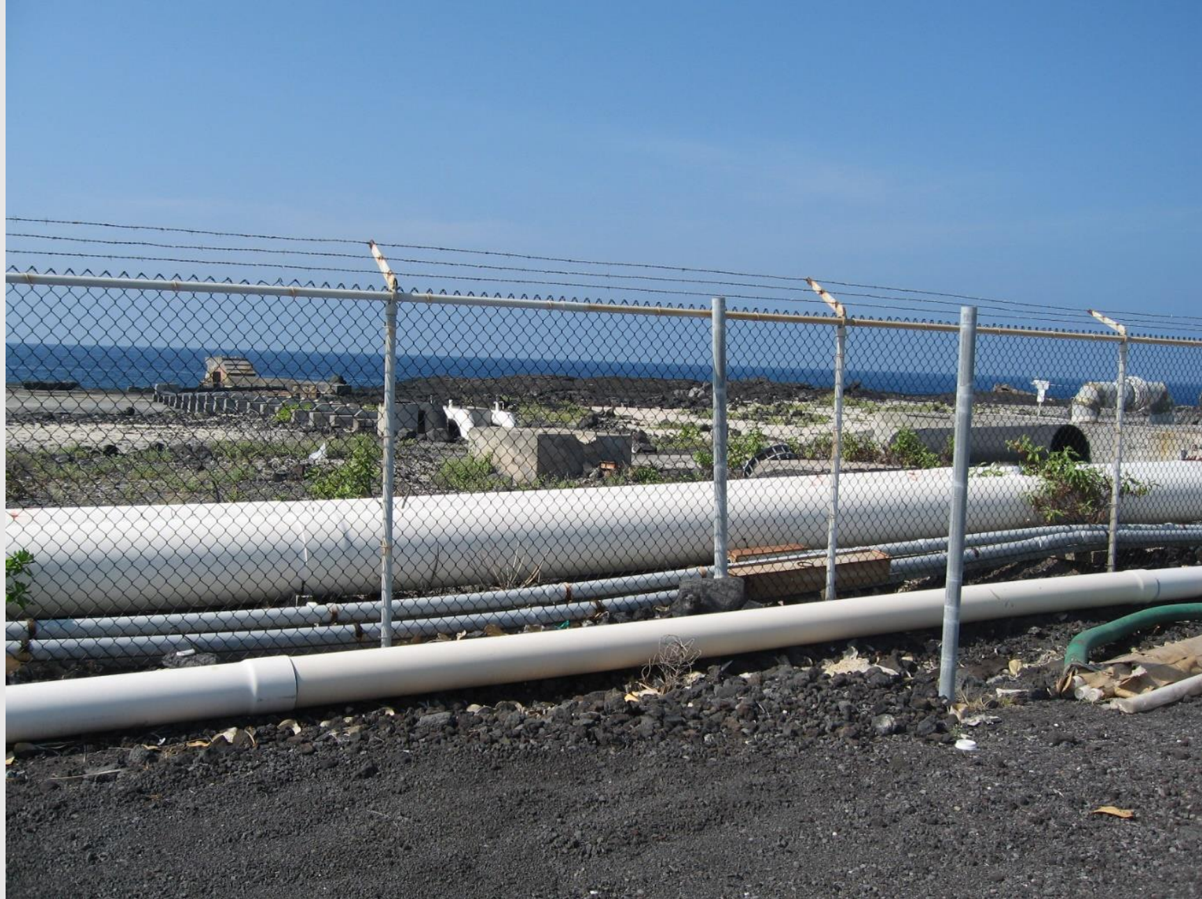
海洋深層水管と表層水管並列配管