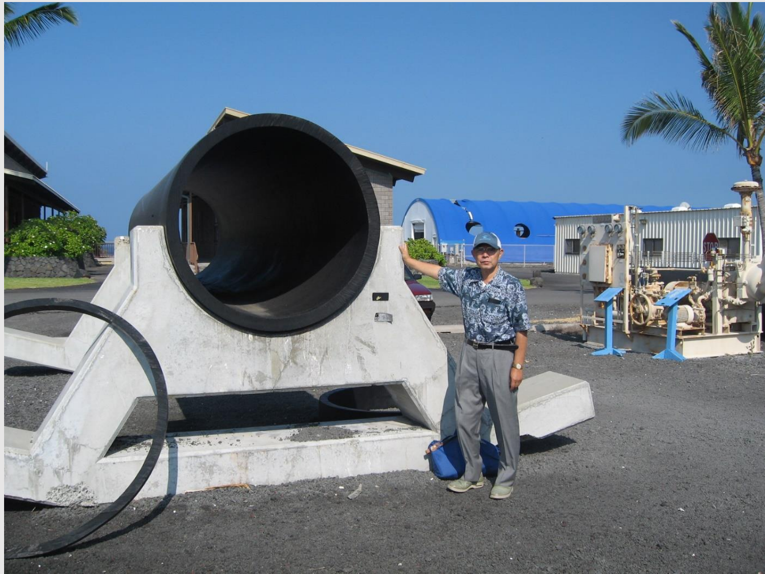
海洋深層水給水管