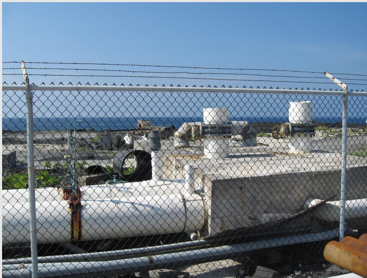
海洋深層水管の分岐場所