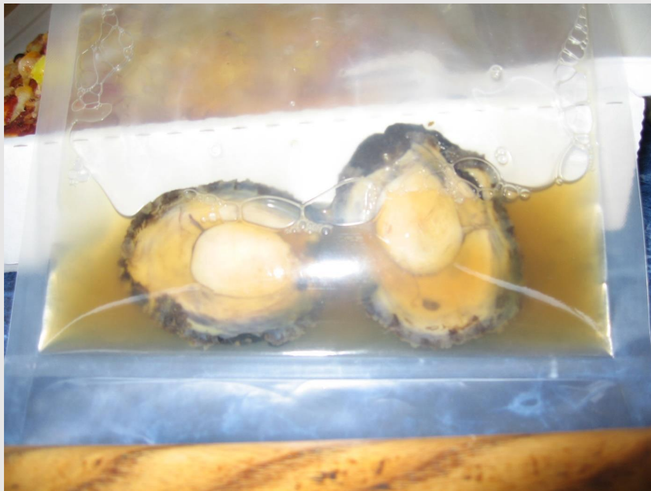
真空冷凍保存製品